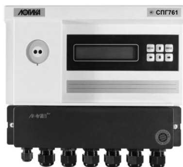
Рисунок 1 – Корректор СПГ761 (СПГ762)

Общий вид составных частей ИК приведен на рисунках 1 – 6.